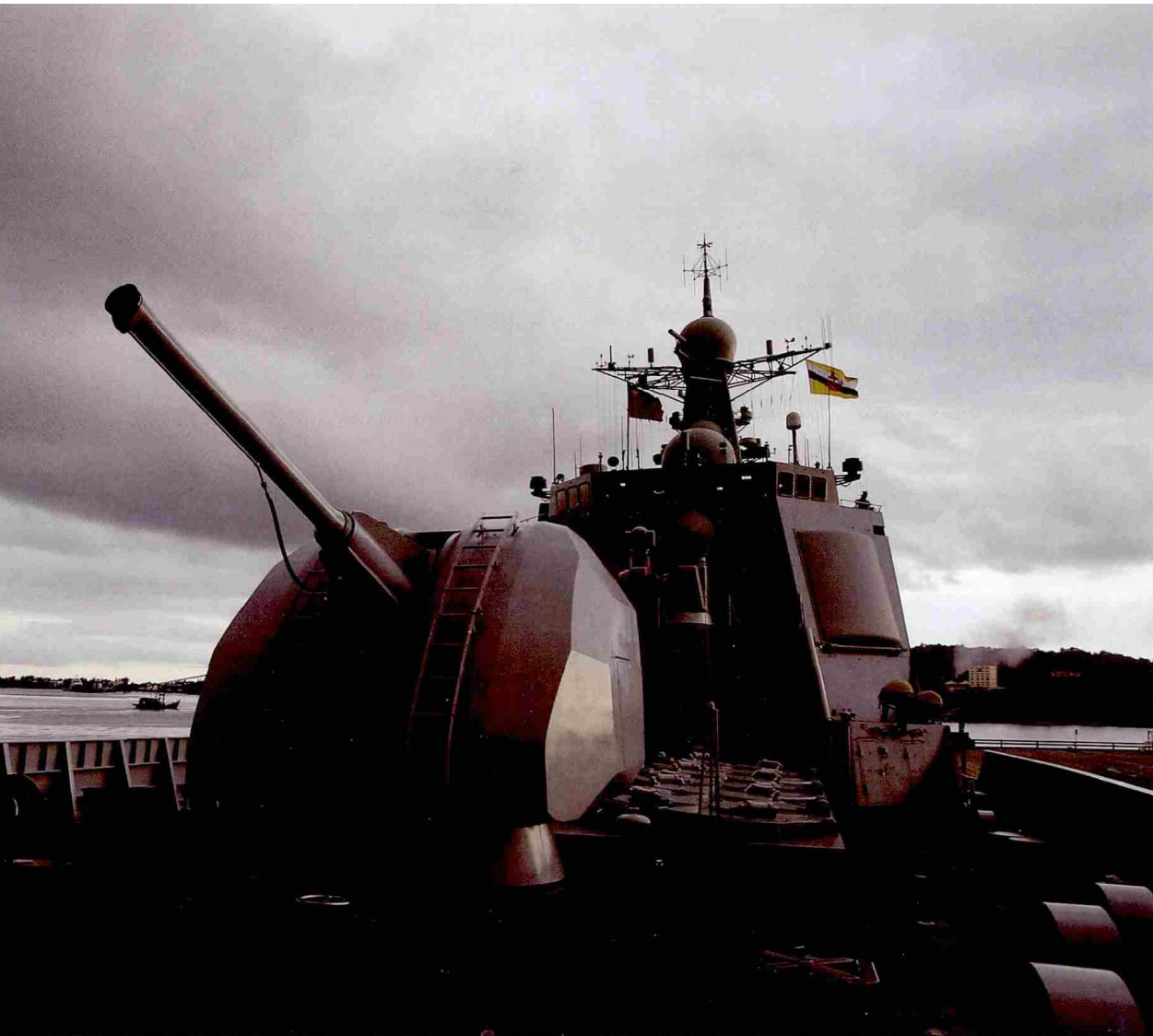
2016年5月3日，东盟防长扩大会议海上安全与反恐联合演习在文莱麻拉海军基地的多国协调中心正式开幕。此次联合演习在文莱、新加坡及两国之间海域举行，于12日结束，参加此次演习的国家有新加坡、越南、菲律宾、马来西亚、泰国、柬埔寨、老挝、缅甸、印度尼西亚、文莱东盟十国及中国、俄罗斯、美国、日本、韩国、澳大利亚、新西兰、印度八国。图为5月3日在文莱斯里巴加湾市拍摄的参加演习的中国军舰“兰州”号导弹驱逐舰。

中国须成为能为南海地区国家和其他利益相关国家提供航行畅通和航行安全“公共产品”的主要国家。中国宣布，在南沙扩建的设施将为各国提供公共服务，建立的灯塔、海啸预报中心、医院等，都是开放的。目前，这样的公共产品较少，将来还应该大幅度增加。不仅仅是自己单方面宣布和实施，未来还应该主动和积极推动建设南海合作公共产品的发展，把它作为推动中国—东盟海上合作的重要议题和内容，逐步发展共同参与的南海合作机制。比如，中国可以倡导召开发展南海“公共产品”的国际会议，邀请区